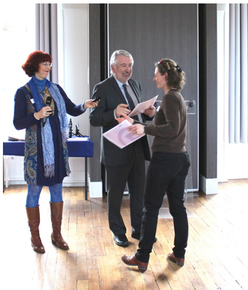
La cellule modernisation a accompagné les porteurs de projet dans leurs démarches