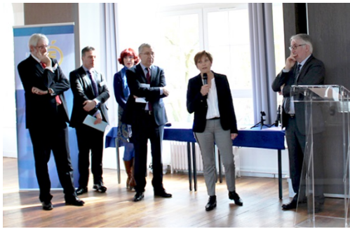
Le prix spécial du jury a été décerné à la D.S.I, pour le projet de certification numérique des diplômes