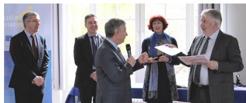
Tous les candidats ont été félicités pour leur participation à l'édition 2016 du prix Impulsion

L'assemblée était ensuite invitée à partager un moment d'échange convivial.